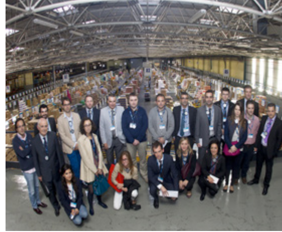
Alumnos de la 6ª edición en la visita al Centro Logístico de Mercadona en Ribarroja.

Comentarios de alumnos de ediciones anteriores